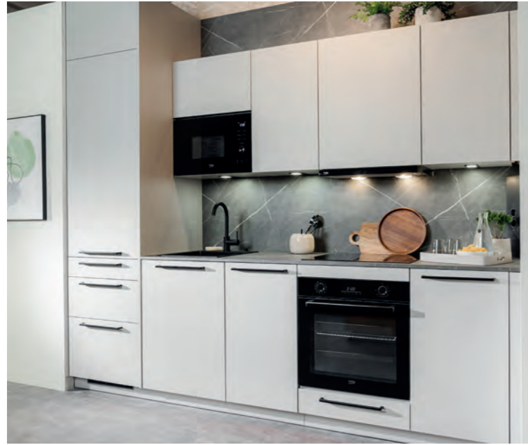
DAN FIRST - Urban Line